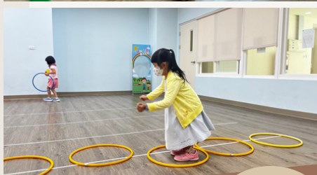
幼兒進行跳躍、爬行 遊戲、呼拉圈遊戲