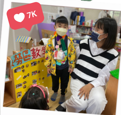
小宥子完成圍巾編織