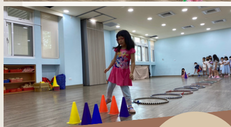
幼兒進行跳躍、觸覺 石遊戲、球類遊戲