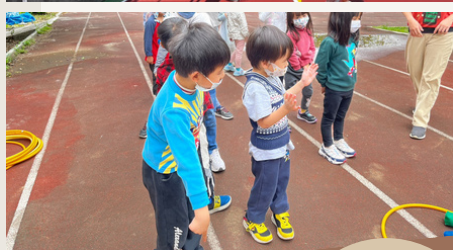
球類運動、呼拉圈遊戲、自由活動